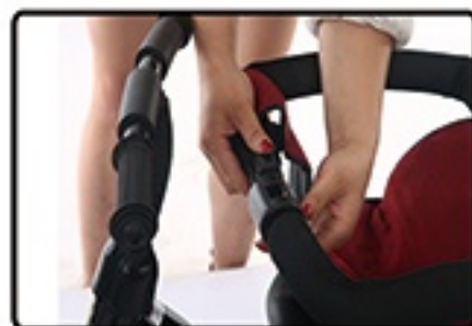
Provincite rukohvat kroz mekano sediste.