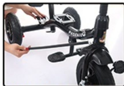
Zakrivljeni deo upravljacke poluge postavite napred.