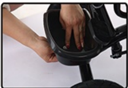
Postavite koricu i zategnite je.