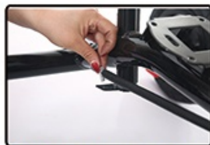
A deo sa maticama pozadi.