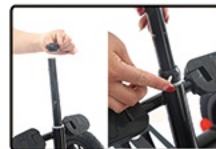
Postavite plastini prsten, provucite sraf i zategnite.