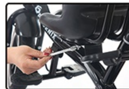
Zatim ga zategnite maticama.