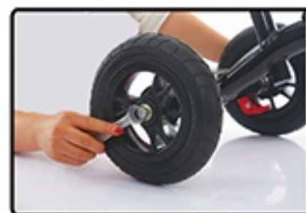
Zategnite matice sa obe strane.