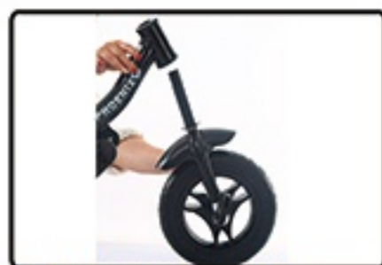
Provincite prednji točak kroz ram.