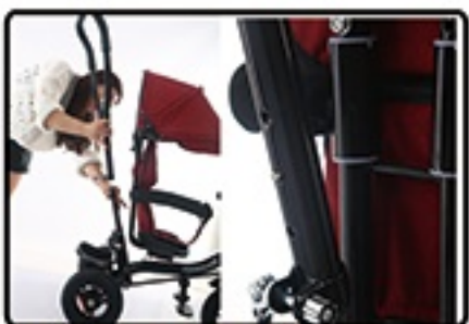
Postavite upravljac je.