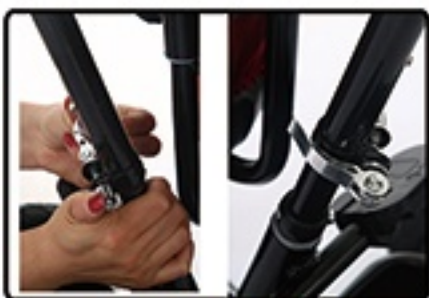
Zategnite ga uz pomoc zatezaca