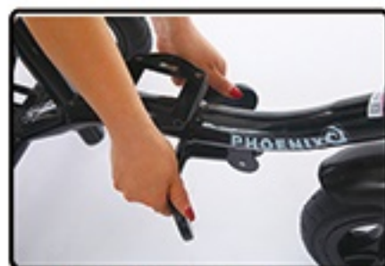
Drzac za noge je moguće sklopiti.