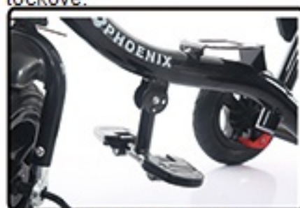
Zatim spustite drzac za noge.