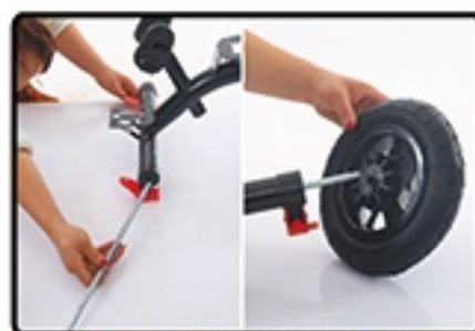
Provincite zadnju osovinu kroz ram i postavite zadnje točkove.