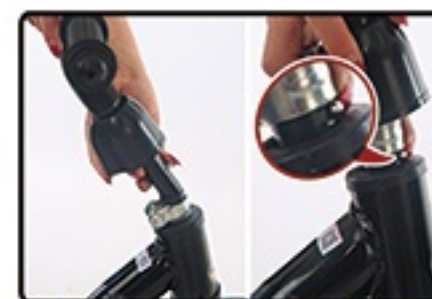
Postavite zatezac kao na slici za zatim postavite guvernal