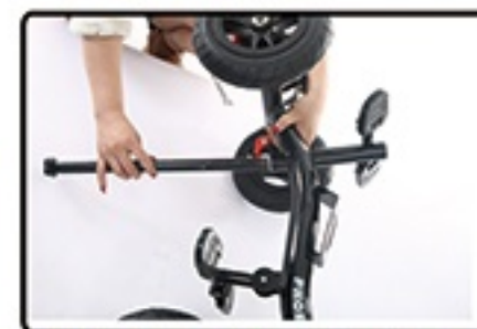
Zatim provucite upravljacku sipku kroz ram.