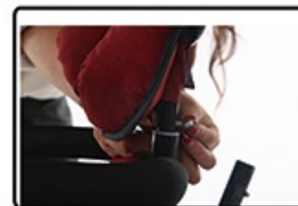
Zategnite drzac tende.