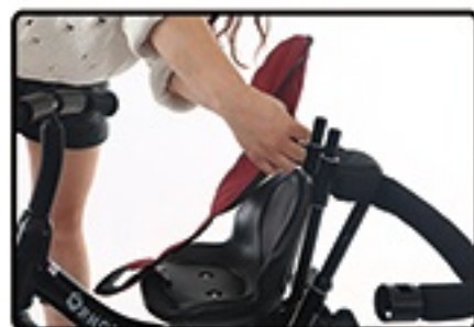
Postavite mekano sediste